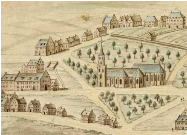
Sint Janskerk in 17 e eeuw. Kanunniken woonden in huizen bij de kerk

Ook spraken kanunniken mee over zaken die het kapittel betroffen en waren ze actief in kerkelijk onderwijs. Voor het levensonderhoud hadden de kanunniken van de bisschop dus onroerend goed toegewezen gekregen, bijvoorbeeld de gronden en hoeven in Beusichem.