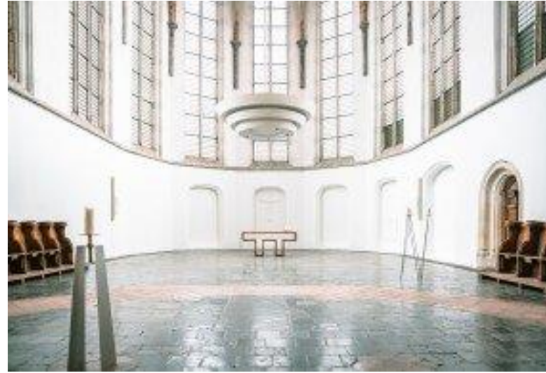
Het koor van de Sint Janskerk in Utrecht doet sterk denken aan het koor in Beusichem.

de gronden zeer lucratief was voor de heren van Beusichem, omdat ze daar weinig voor betaalden. Dat was pacht of vroeger ook tienden.