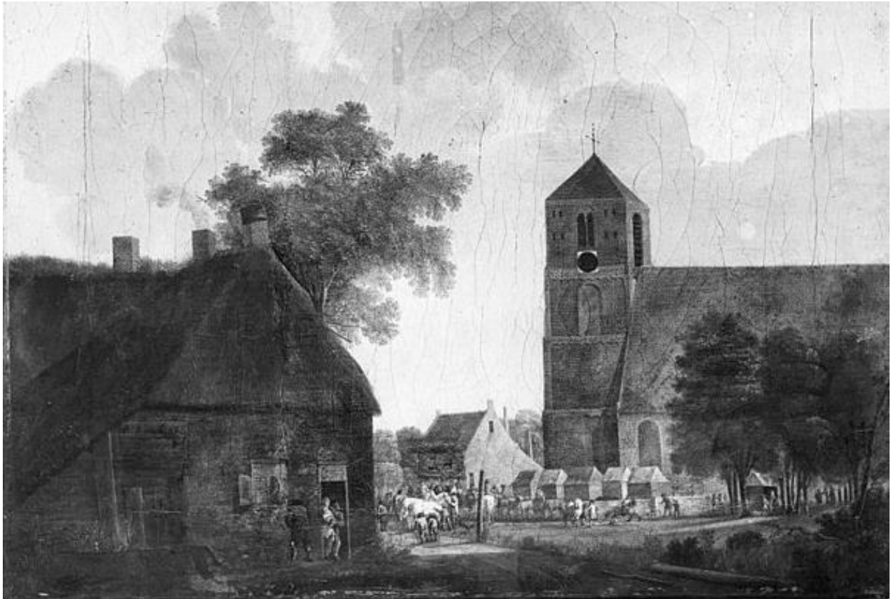
Op dit 17 e -eeuwse schilderij is de Markt al verbreed

Hoe is een dorp als Beusichem ontstaan en gegroeid? Dat is aan het verloop van wegen en kavels grond op oude kaarten te herleiden. Geografen kunnen zo veel aflezen van planning van een oud dorp. Dat is eerder ook gedaan voor Beusichem en gepubliceerd in het tijdschrift Nederlandse Geografische Studies . Geograaf J. Harten trok de volgende conclusies: