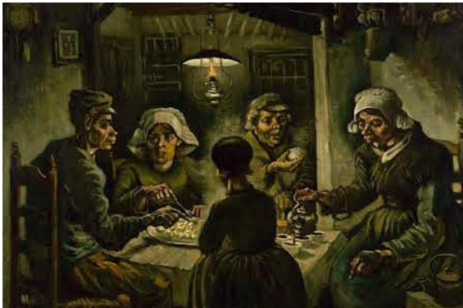
De aardappeleters van Vincent van Gogh portretteert een boerengezin in 1885 in Nuenen.

Vooraf in de periode 1890-1930 was dat zichtbaar, de periode waar de landbouwcrisis en grote depressie een rol in speelden. De landbouwcrisis ontstond eind 19 e eeuw door goedkope import van granen, waardoor prijzen fors daalden. De opkomst van de margarine-industrie raakte de vraag naar boter. Door het grote vertrekoverschot in het rivierkleigebied, verouderde de bevolking. De onaantrekkelijkheid van het seizoenskarakter van de werkgelegenheid in de steenindustrie maakte dit ongunstige beeld in dit gebied niet goed.