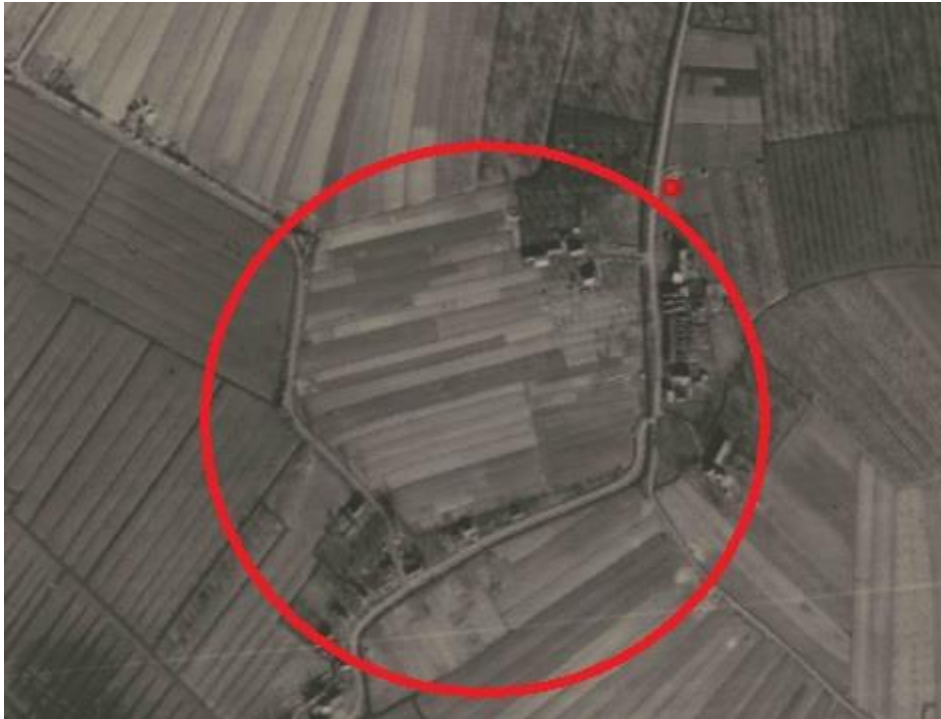
Foto aan het einde van de Tweede wereldoorlog door Britse luchtmacht gemaakt. We zien akkers in horizontale richting met afwatering naar de sloot langs Ganssteeg. Veel kleine smalle percelen. De kleurverschillen duiden op meerdere verschillende kleine teelten, of zijn het greppels die scheiding vormen?